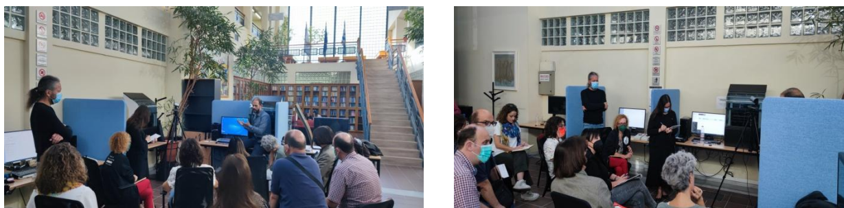
Εικόνα 3: Στιγμιότυπα από την εκπαίδευση του προσωπικού των Βιβλιοθηκών στη χρήση του εξοπλισμού.

Η προμήθεια, εγκατάσταση και λειτουργία του εξοπλισμού έγινε από το ΠΑΔΑ στο πλαίσιο της Πράξης «ΠΡΟΣΒΑΣΗ», με χρηματοδότηση από το ΕΣΠΑ μέσω του μηχανισμού της απόσβεσης. Το προσωπικό των Βιβλιοθηκών παρακολούθησε τον Οκτώβριο και Νοέμβριο 2022 εκπαίδευση στη λειτουργία και χειρισμό του εξοπλισμού (hardware και λογισμικό) από την προμηθεύτρια εταιρία enLogic ( Εικόνα 3 ).